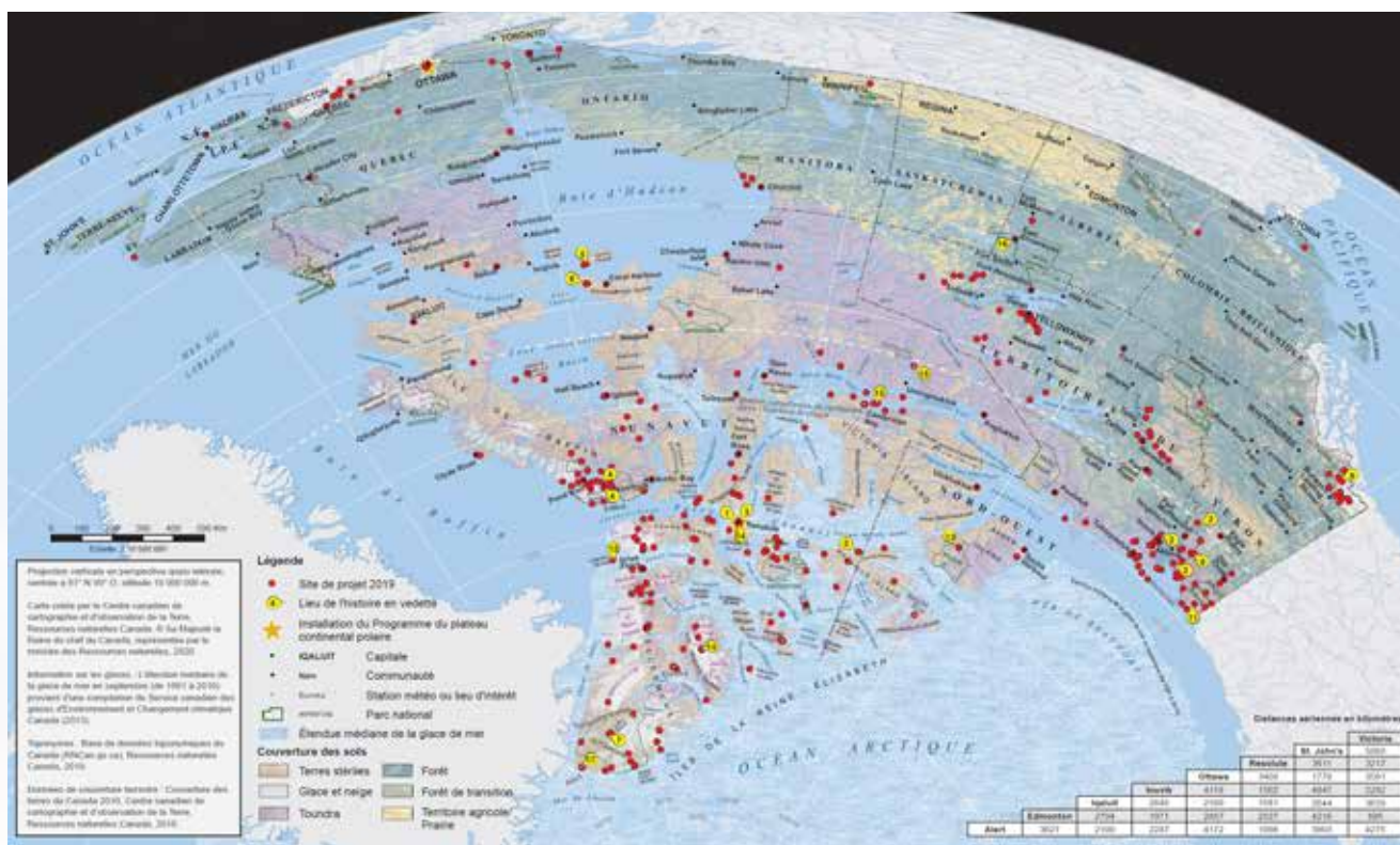
Figure 3. Sites de projet soutenus par le PPCP en 2019 (Ressources naturelles Canada, 2020)

La sélection des bons projets et l'optimisation de la logistique sont d'autant plus importantes que les coûts de la recherche dans le Nord sont élevés et les ressources limitées et que les activités scientifiques dans l'Arctique et les régions subarctiques ne cessent de croître. Le processus de sélection des projets du PPCP, tel qu'il est présenté dans ses propres documents d'évaluation du programme, est cité dans l'encadré 2. L'évolution des critères de notation des projets et la mobilisation de la communauté nordique peuvent offrir des possibilités d'améliorer les résultats du programme.