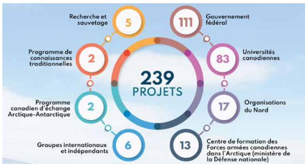
Figure 2. Répartition des projets soutenus par le PPCP en 2019 (Ressources naturelles Canada, 2020)

Le PPCP a déployé des efforts importants à cet égard, comme l'inclusion d'un critère de notation sur la participation des communautés autochtones dans son évaluation des projets universitaires et le soutien au programme de formation sur le terrain des Inuits d'ECCC, mais il y a encore place à l'amélioration. Au début des années 1990, le PPCP a mis en place un sous-programme de connaissances traditionnelles qui a permis aux communautés,